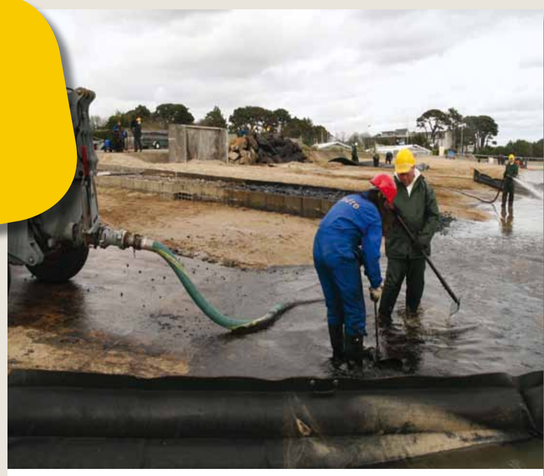
Pompage sur plan d'eau