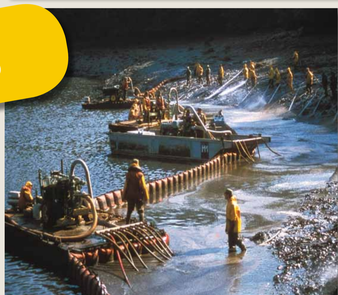
Saturation en eau