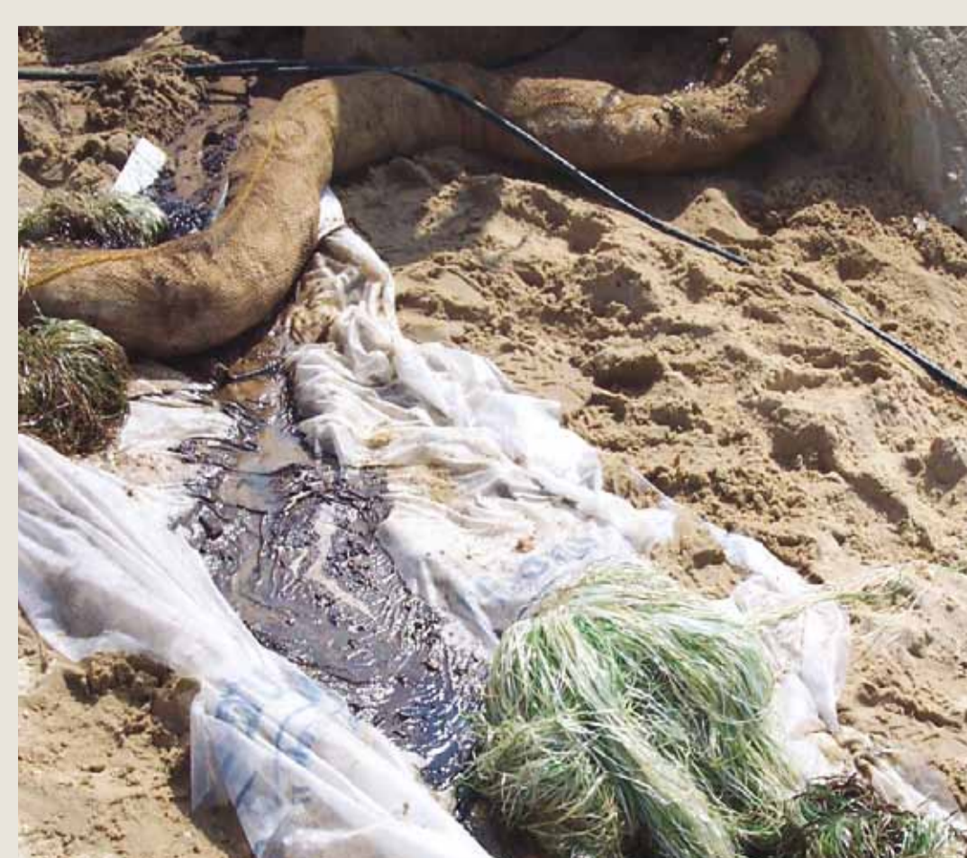
Absorbants / filtration