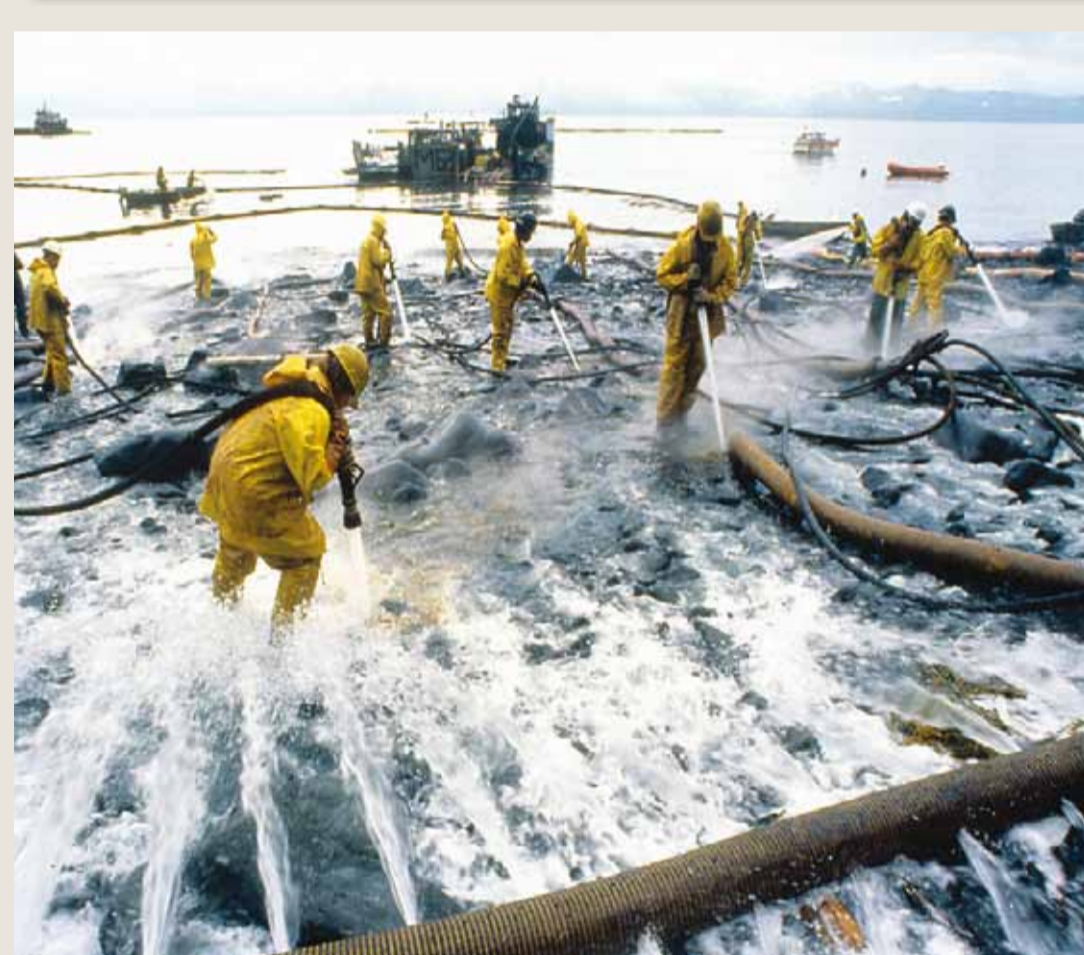
Saturation en eau