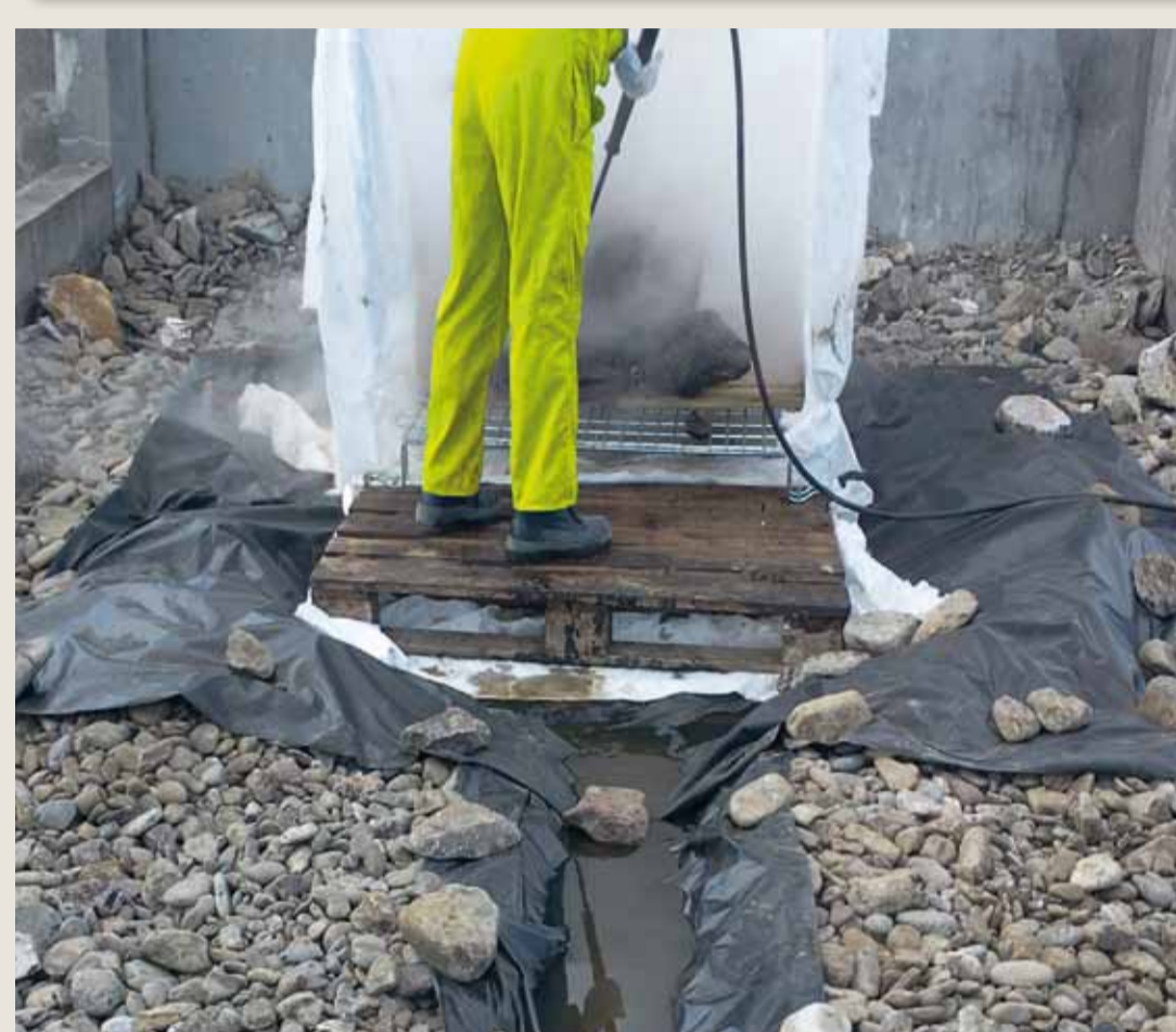
Nettoyage en cage