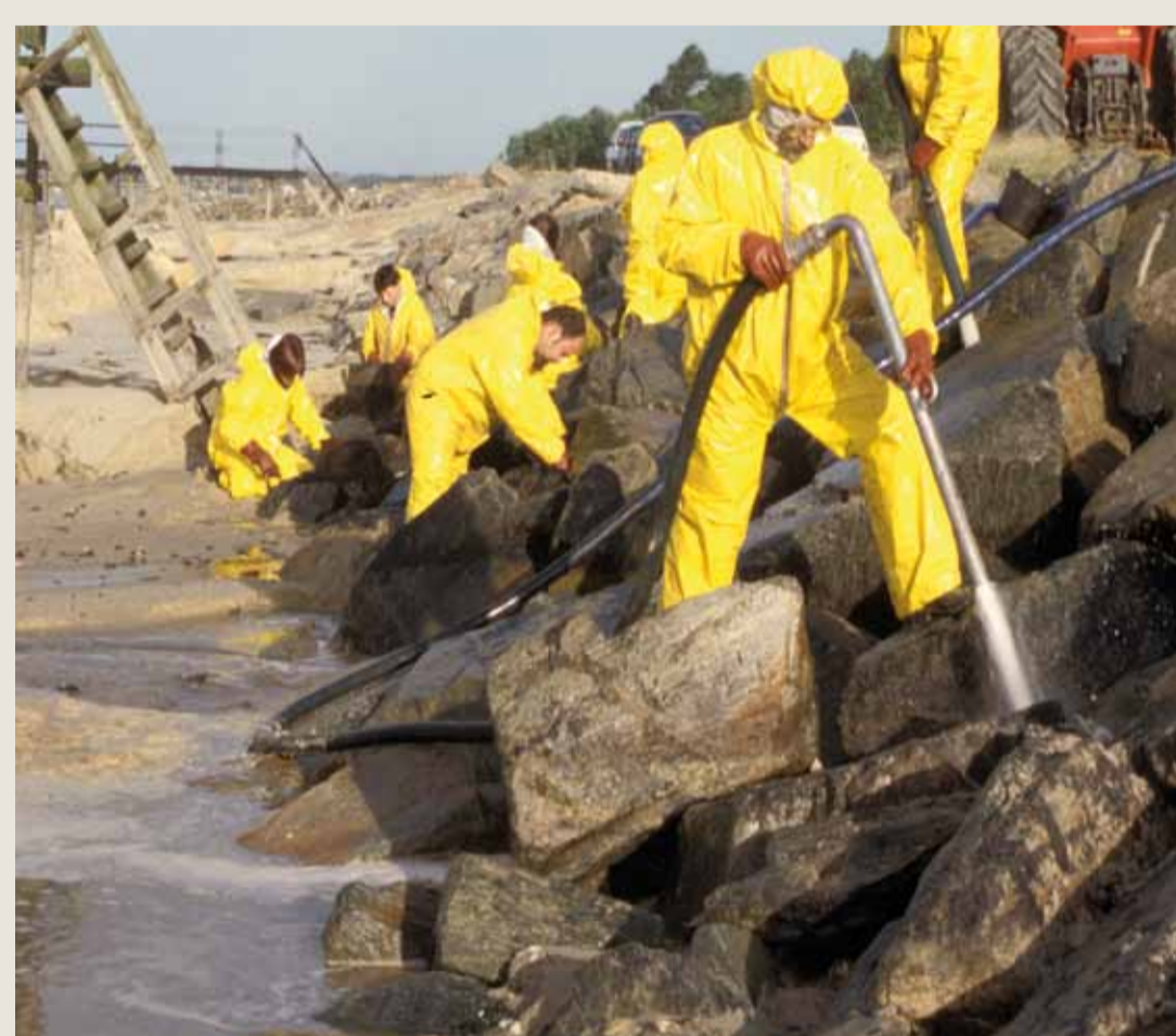
Rinçage basse pression