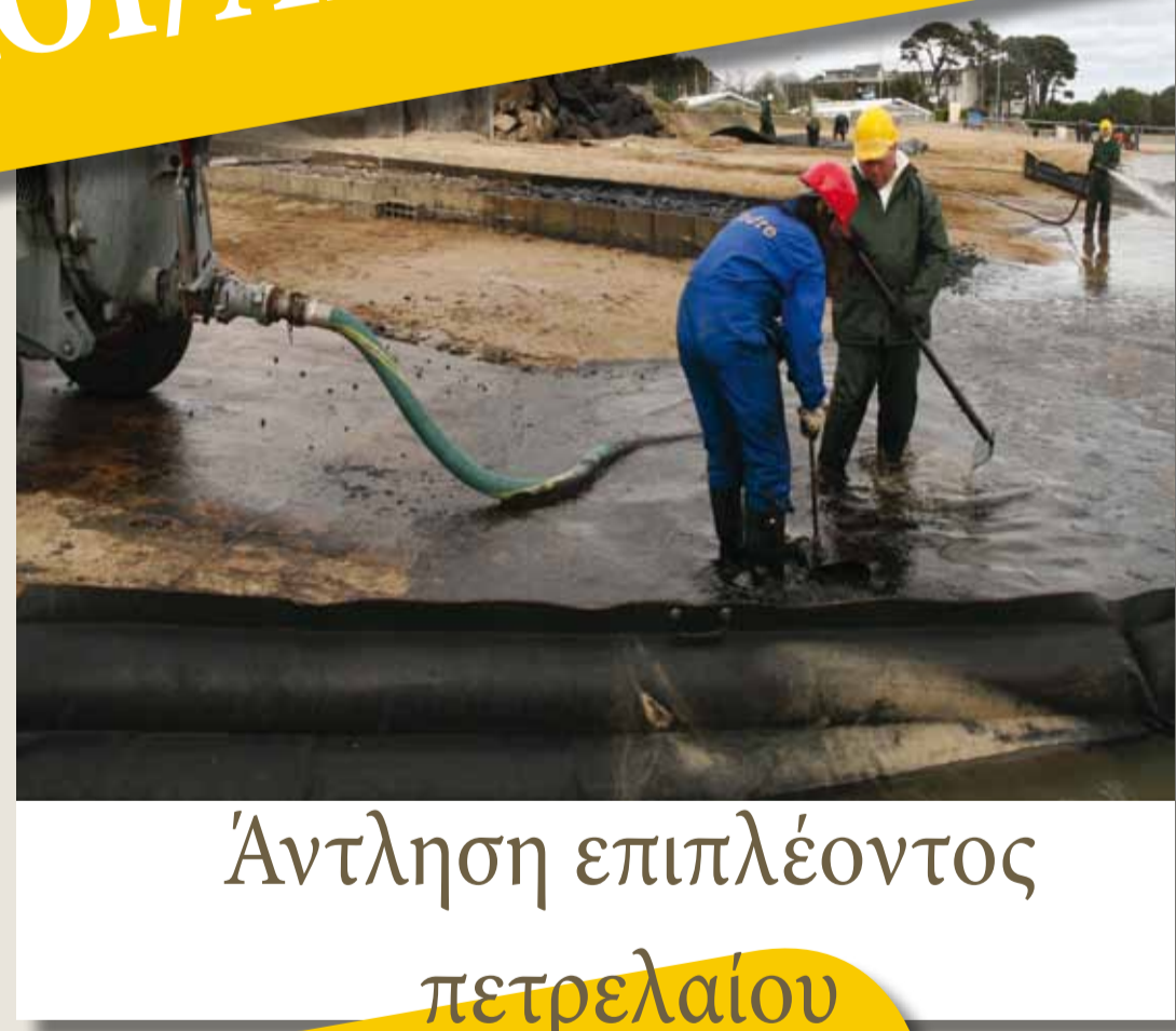
Άντληση επιπλέοντος πετρελαίου