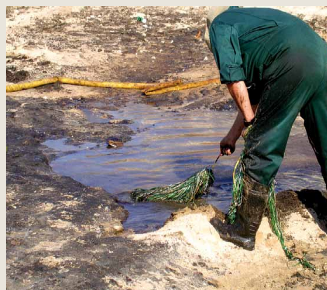
Χρήση προσροφητικών υλικών