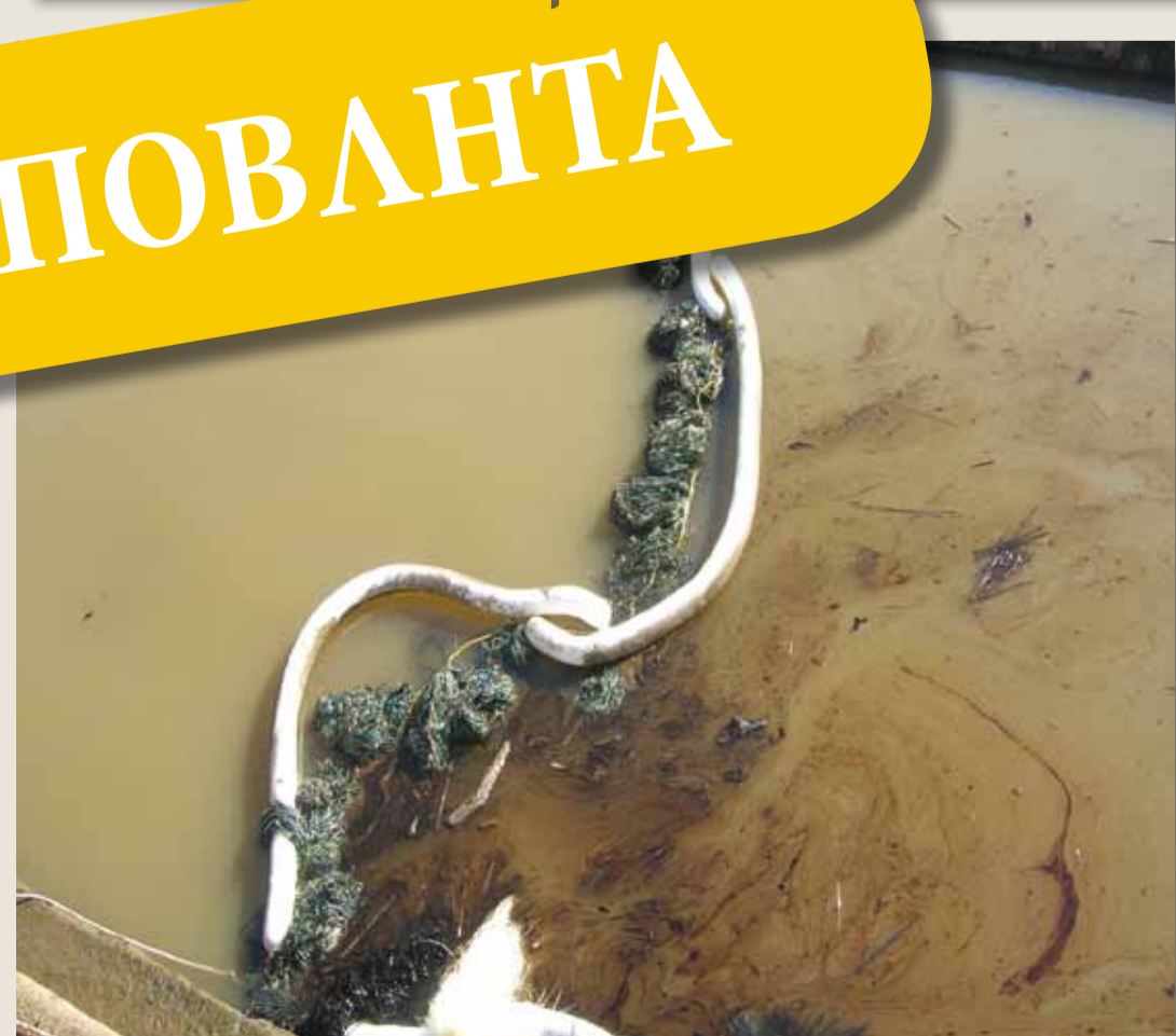
Προσοφητικά υλικά/ Φράγμα