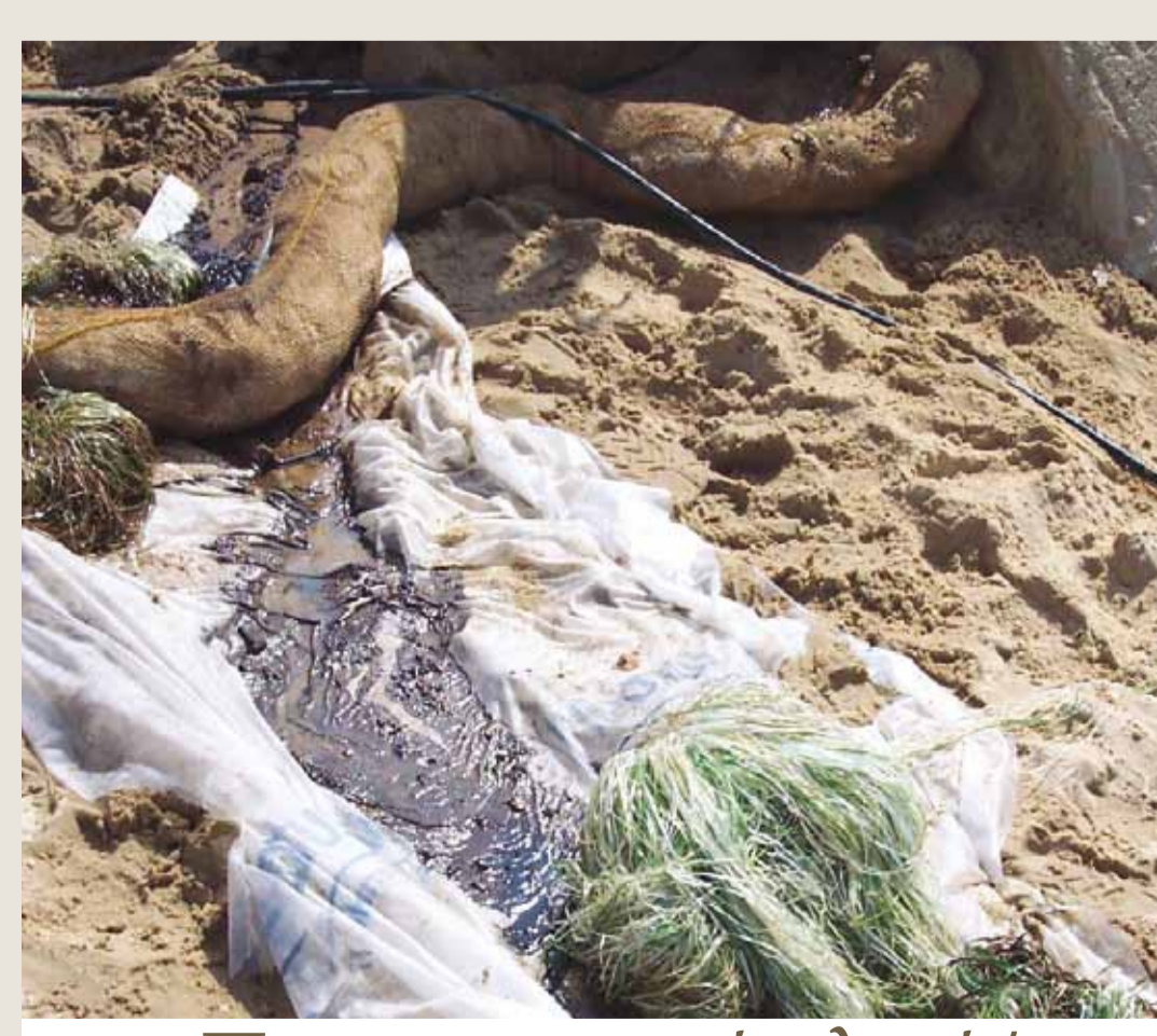
Προσοφητικά υλικά/ φιλτράρισμα