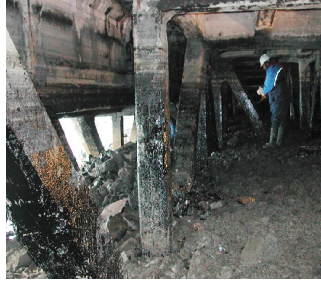
منطقة تم احتوائها