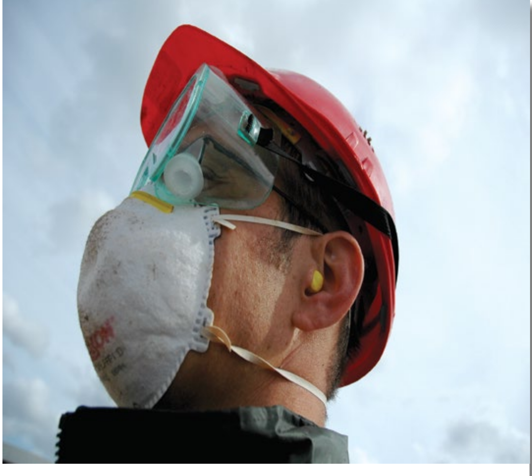
الرأس ، الأذن والوجه