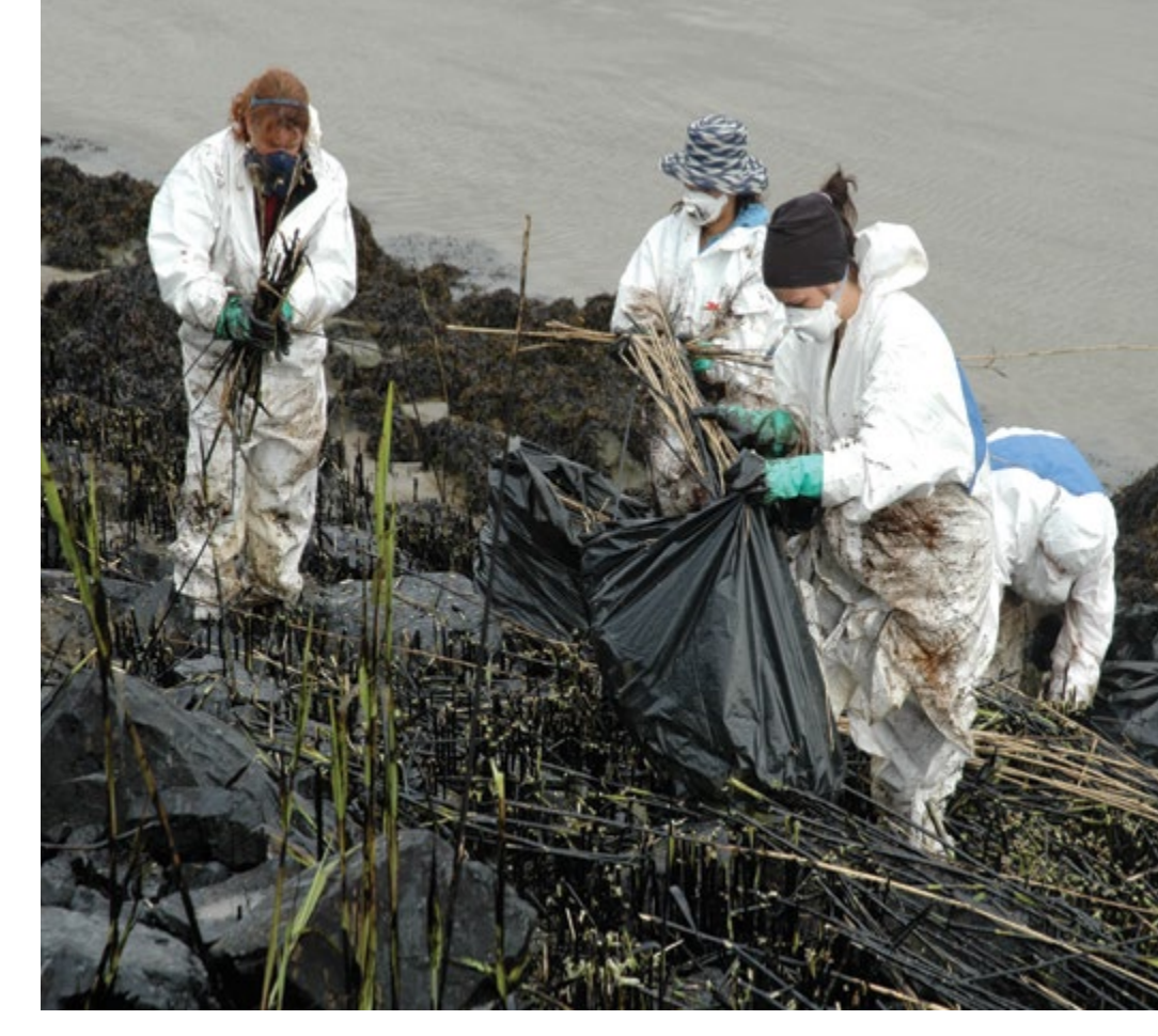
معدات وقاية شخصية نظيفة