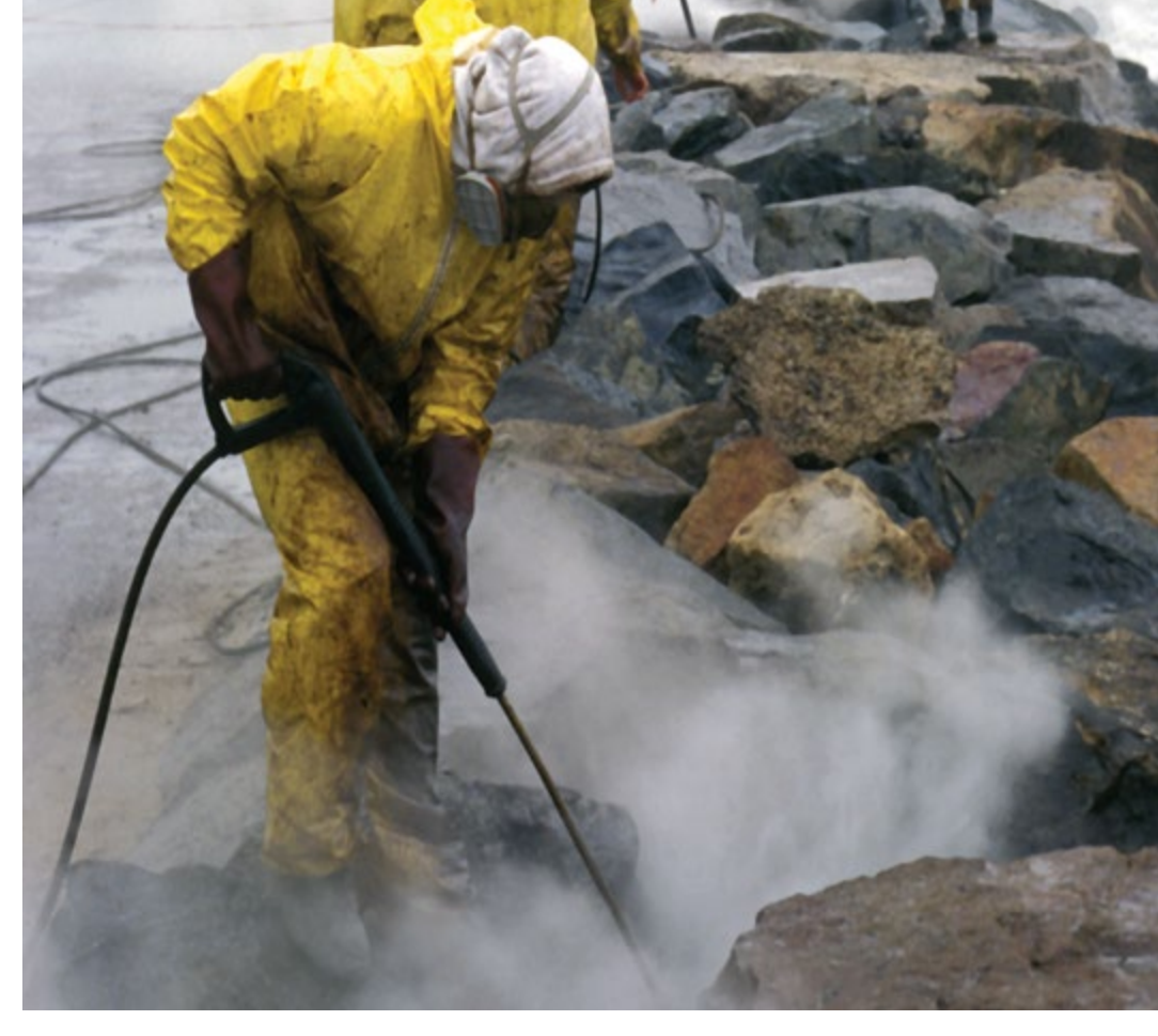
عملية الغسيل بالضغط العالي