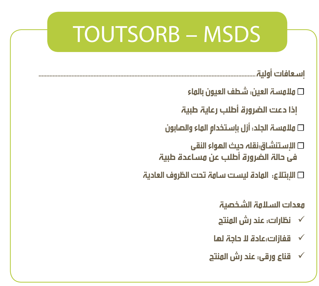
صحيفة بيانات سلامة المواد